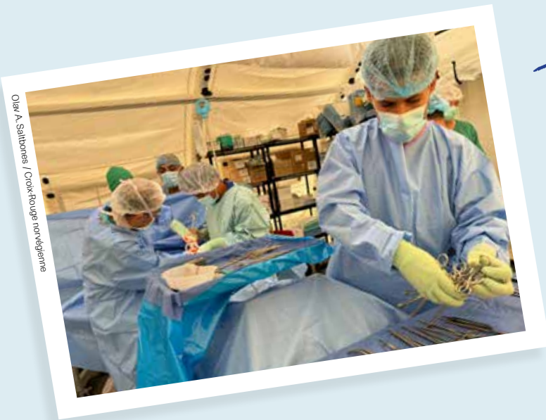
Olivier A. Saitboras / Croix-Rouge norvégienne