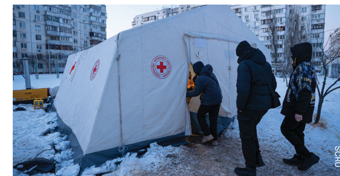
Un centre de réchauffement permanent de la Société de la Croix-Rouge d'Ukraine.

Grâce à vous, les équipes d'intervention d'urgence (EIU) disposent de l'équipement nécessaire pour continuer à offrir des soins essentiels aux personnes touchées par le conflit. Votre générosité a permis de fournir 20 points de réchauffement permanents et 15 ambulances à la Société de la Croix-Rouge d'Ukraine. Ces points de chauffage et ces ambulances représentent une façon supplémentaire par laquelle vous soutenez la prestation d'une aide humanitaire vitale en Ukraine.