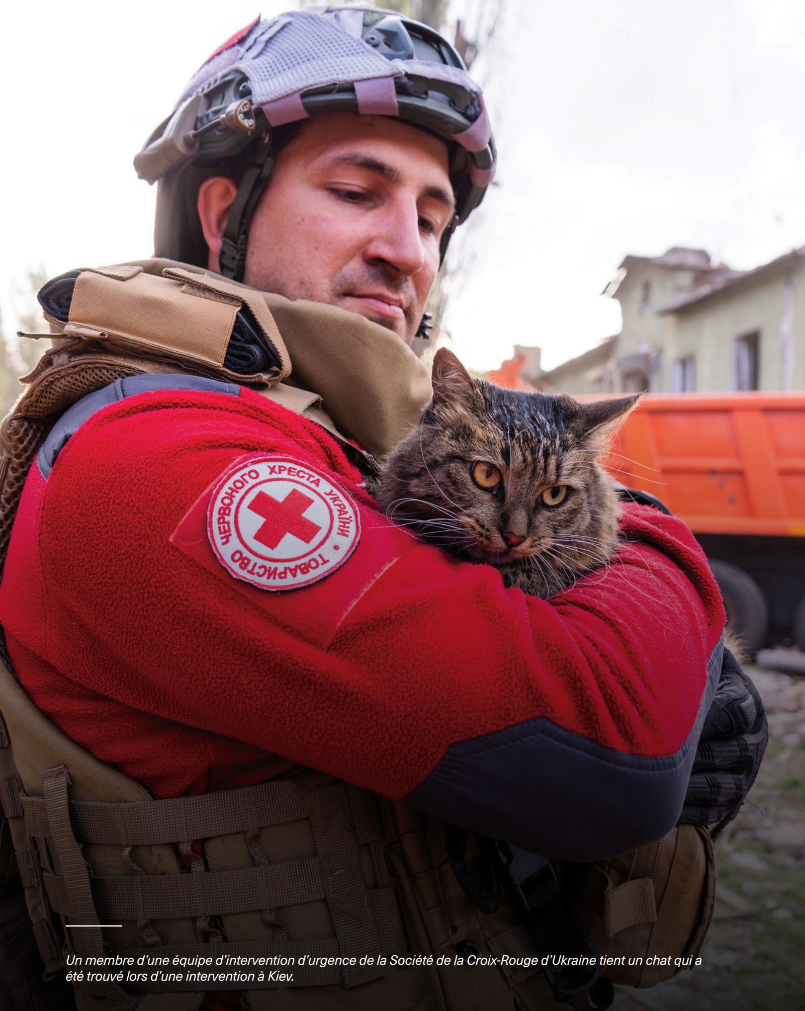
Un membre d'une équipe d'intervention d'urgence de la Société de la Croix-Rouge d'Ukraine tient un chat qui a été trouvé lors d'une intervention à Kiev.