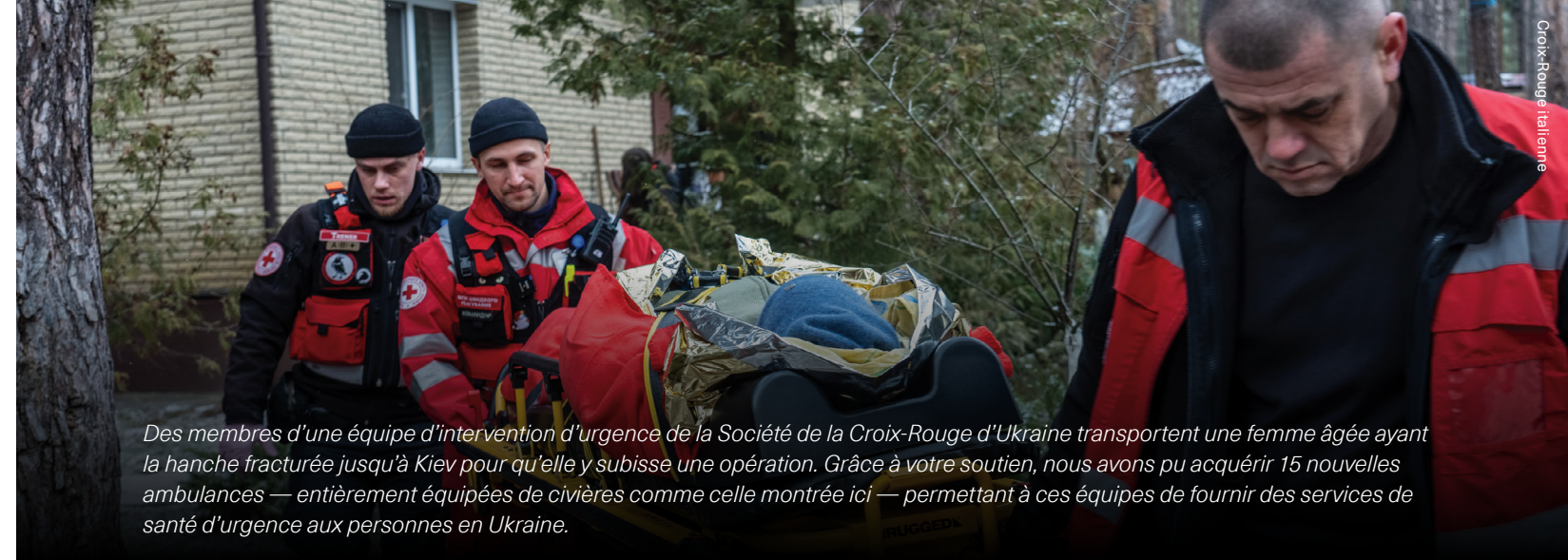
Des membres d'une équipe d'intervention d'urgence de la Société de la Croix-Rouge d'Ukraine transportent une femme âgée ayant la hanche fracturée jusqu'à Kiev pour qu'elle y subisse une opération. Grâce à votre soutien, nous avons pu acquérir 15 nouvelles ambulances — entièrement équipées de civières comme celle montrée ici — permettant à ces équipes de fournir des services de santé d'urgence aux personnes en Ukraine.

— VALENTYN KOZHANOV , COORDONNATEUR DU PROGRAMME D'ABRIS ET DE CONSTRUCTION, CROIX-ROUGE CANADIENNE