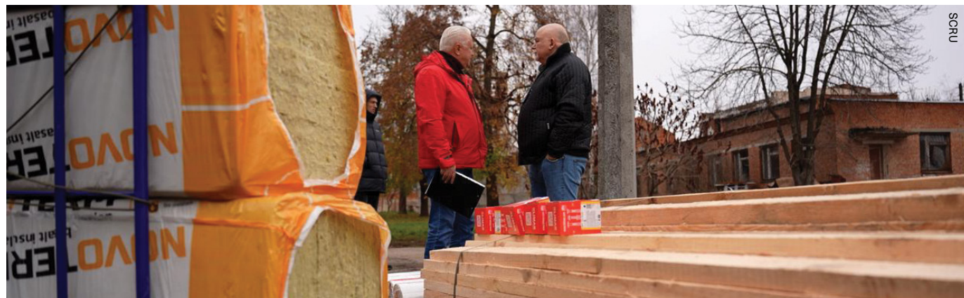
Les donateurs de l'initiative Remise sur pied des établissements de santé ont fourni des matériaux de construction essentiels pour aider à réparer le toit d'une maternité à Soumy.

Bien que le Centre de cardiologie et de chirurgie cardiaque pédiatrique ait rouvert, de nombreux centres de santé demeurent malheureusement fermés ou fonctionnent avec une capacité réduite en raison du conflit.