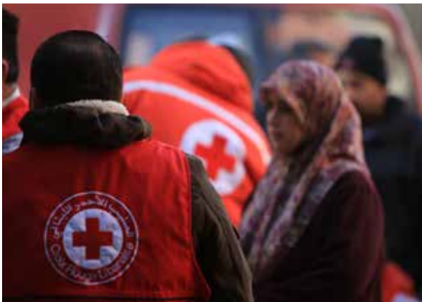
Ibrahim Malla / FICR

C'est grâce à nos généreux donateurs que la Croix-Rouge canadienne, ainsi que d'autres sociétés nationales, peuvent fournir des services de santé aux personnes dans le besoin.