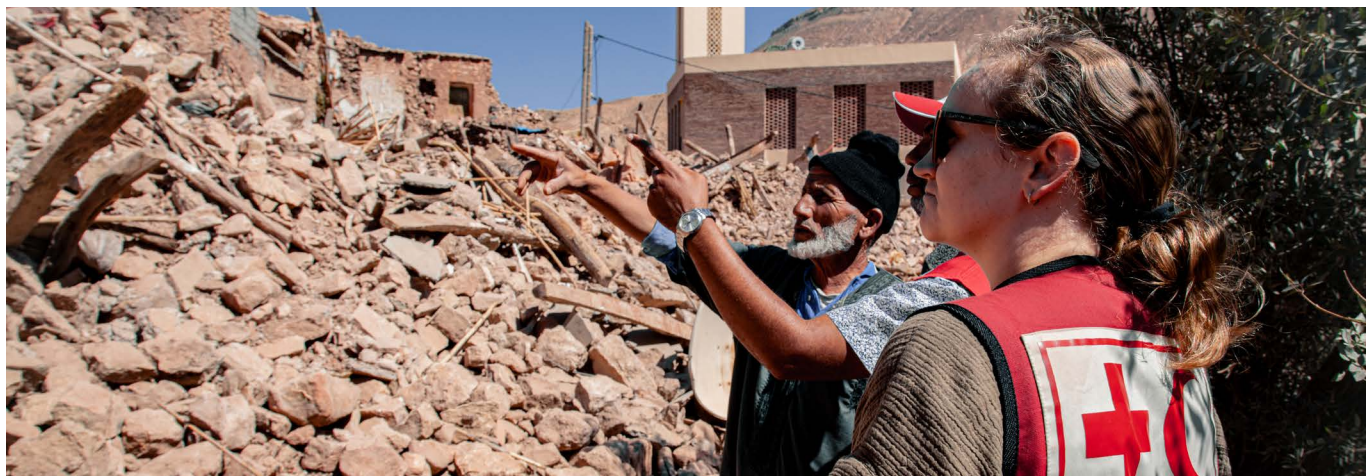
Benoit Carpentier / IFRC