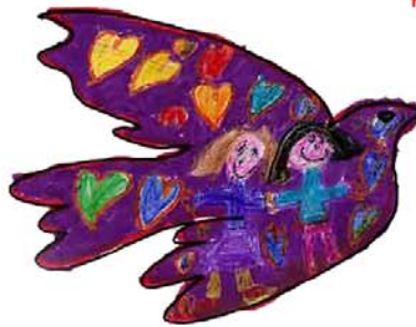
Anne Diotte, 1 re année, St-Chrysostome