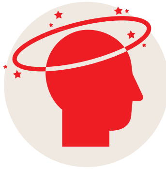
SOMNOLENCE EXTRÊME OU INCONSCIENCE