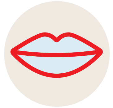
PEAU OU LÈVRES BLEUES, PÂLES OU GRISÂTRES