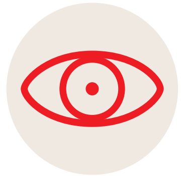
PUPILLES TRÈS PETITES