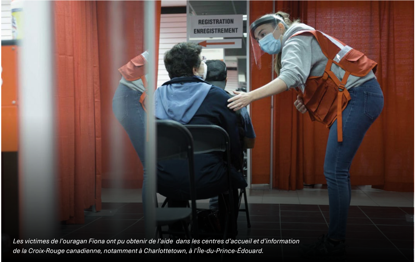
Les victimes de l'ouragan Fiona ont pu obtenir de l'aide dans les centres d'accueil et d'information de la Croix-Rouge canadienne, notamment à Charlottetown, à l'Île-du-Prince-Édouard.

Grâce à la générosité de nos donateurs et de celle d'organismes communautaires, d'entreprises et de partenaires gouvernementaux, notre Fonds de secours : ouragan Fiona au Canada a recueilli, en date du 31 décembre 2022, plus de 31 millions de dollars. Ces fonds ont tous été alloués à ce jour et excluent les dons amassés lors de la campagne de jumelage du gouvernement fédéral.