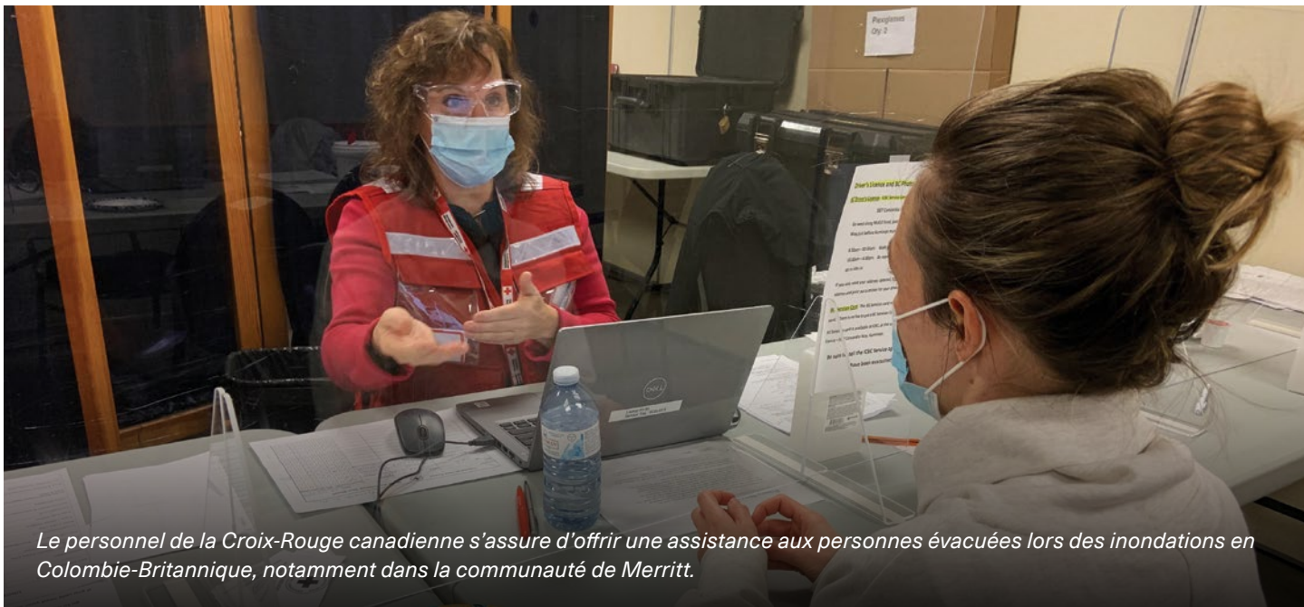
Le personnel de la Croix-Rouge canadienne s'assure d'offrir une assistance aux personnes évacuées lors des inondations en Colombie-Britannique, notamment dans la communauté de Merritt.