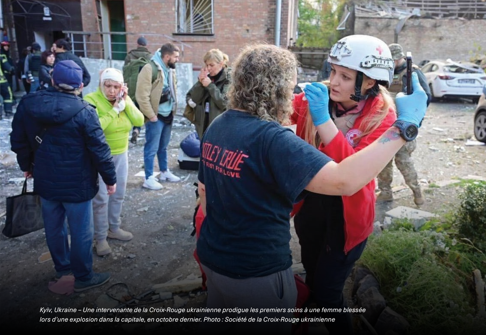
Kyiv, Ukraine – Une intervenante de la Croix-Rouge ukrainienne prodigue les premiers soins à une femme blessée lors d'une explosion dans la capitale, en octobre dernier.