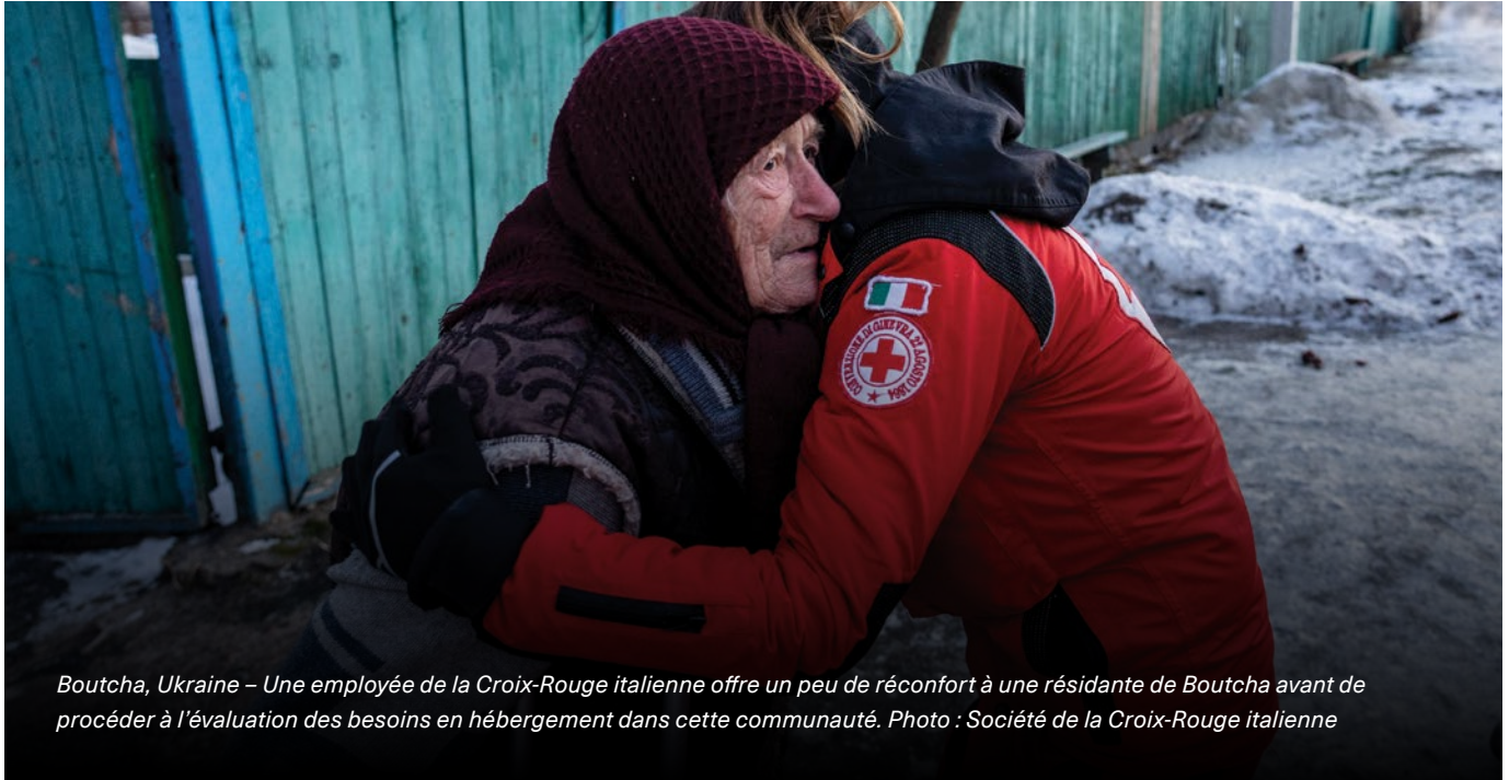
Boutcha, Ukraine – Une employée de la Croix-Rouge italienne offre un peu de réconfort à une résidante de Boutcha avant de procéder à l'évaluation des besoins en hébergement dans cette communauté.

Bien que l'hiver se soit avéré moins rude qu'anticipé, le froid et la destruction d'infrastructures essentielles ont néanmoins menacé de nombreuses vies à travers l'Ukraine. On estime qu'environ quatre millions de personnes ont eu recours à une forme ou une autre d'assistance humanitaire pour survivre cet hiver.