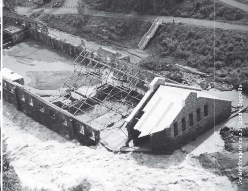
Atelier d'imagerie de la 3 - Escadre Bagotville