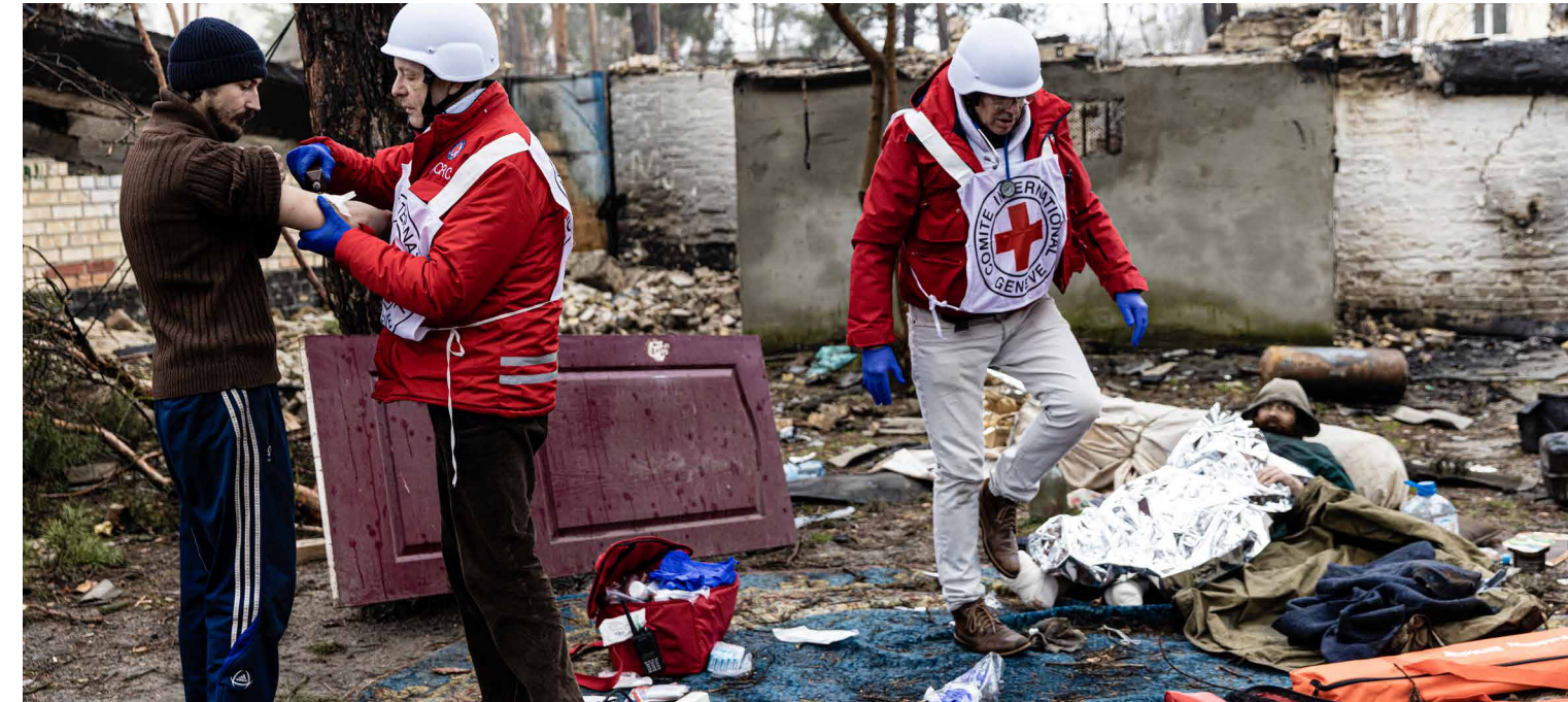
Le 2 avril 2022, Irpin, Ukraine – Une équipe médicale de la Croix-Rouge assure les premiers soins aux évacués de la ville d'Irpin qui a été la cible de violents combats.