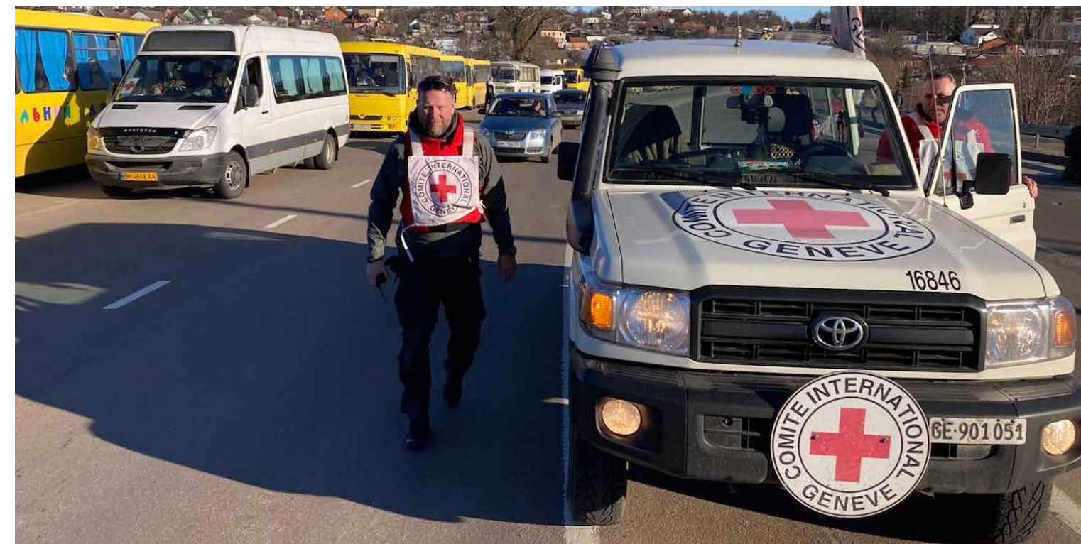
Le 15 mars 2022, Soumy, Ukraine – Les 15 et 18 mars dernier, la Croix-Rouge a escorté un convoi de plus de 80 autobus à bord desquels se trouvaient des milliers de personnes désireuses de quitter la ville de Soumy. Votre appui permet à des civils de gagner des endroits plus sécuritaires.

Grâce à la générosité de nos donateurs et de celle des organismes communautaires, des entreprises et de nos partenaires gouvernementaux, le fonds d'urgence de la Croix-Rouge dédié à la crise humanitaire en Ukraine a amassé 158 M $ en date du 25 avril, dont 30 M $ versés en contrepartie par le gouvernement du Canada.